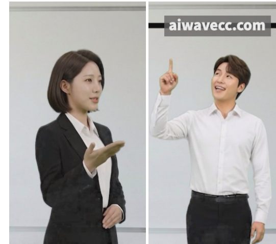
AI기술을 활용한 홍보 숏츠 제작